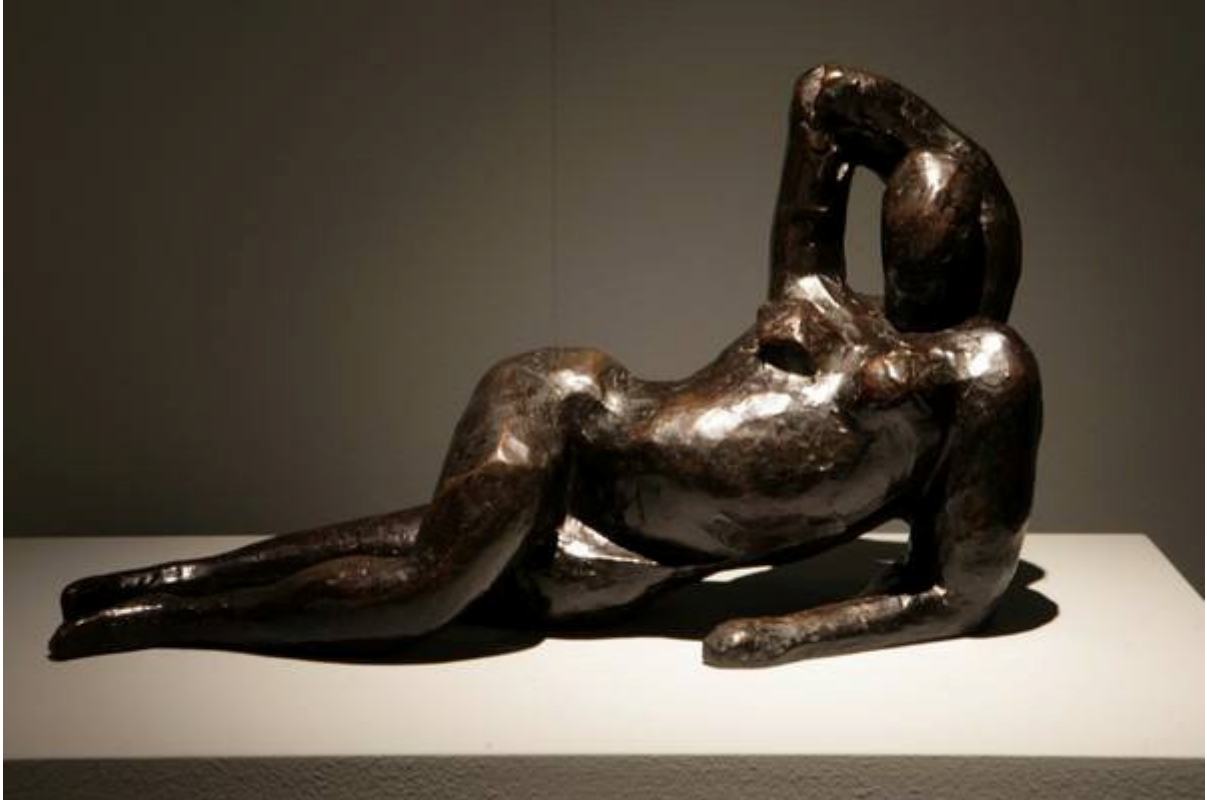
Henri Matisse - Nudo disteso (Aurora), 1907