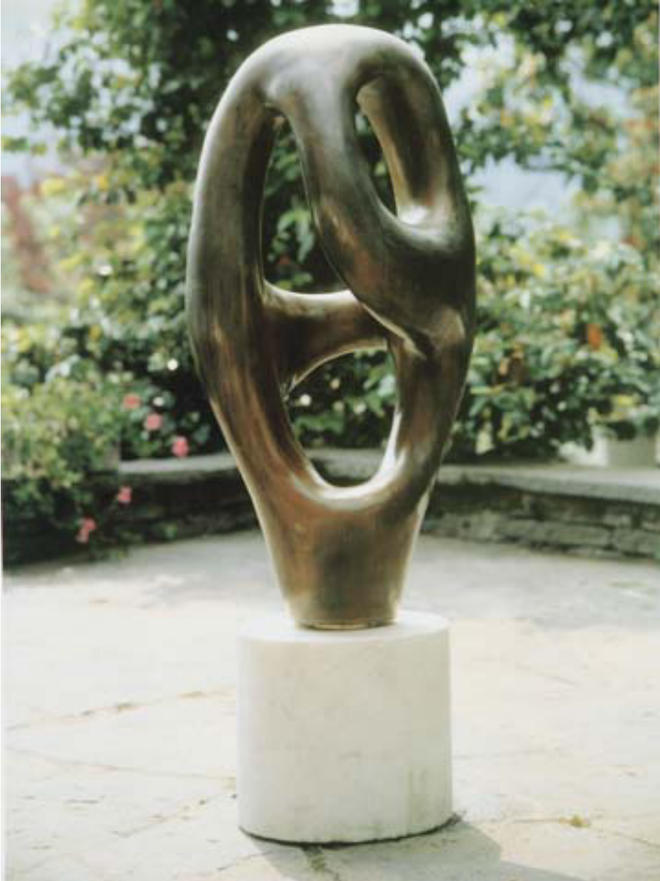
Jean Hans Arp – Tolomeo 1953