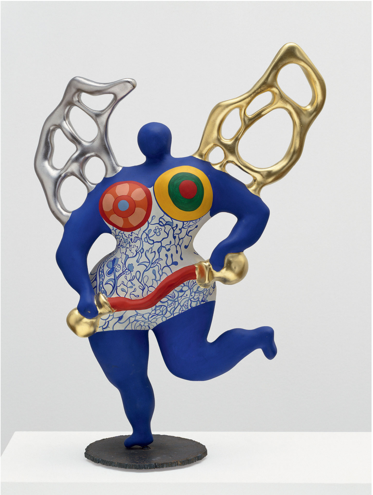
Niki De Saint Phalle – La temperanza 4