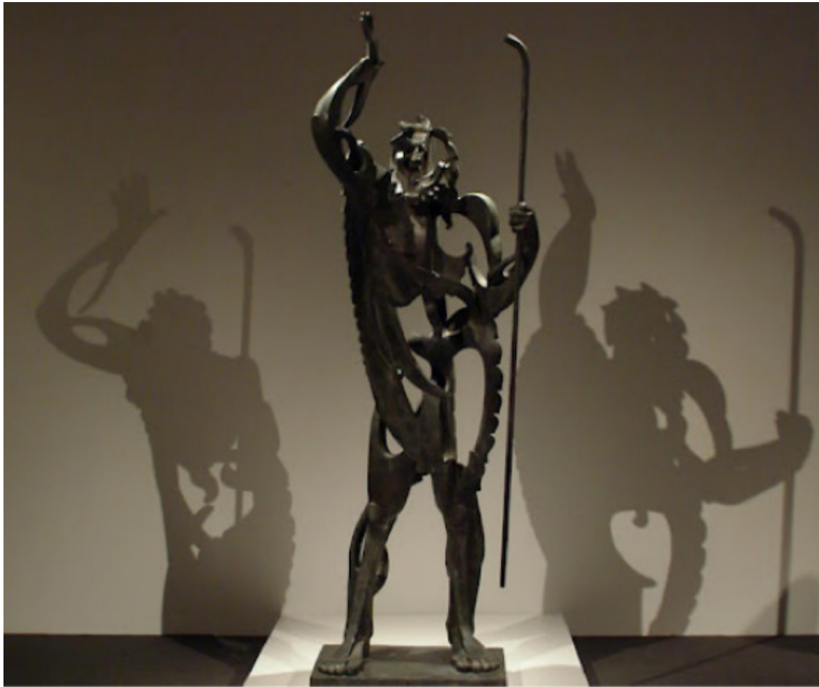
Gargallo - Il Profeta 1933