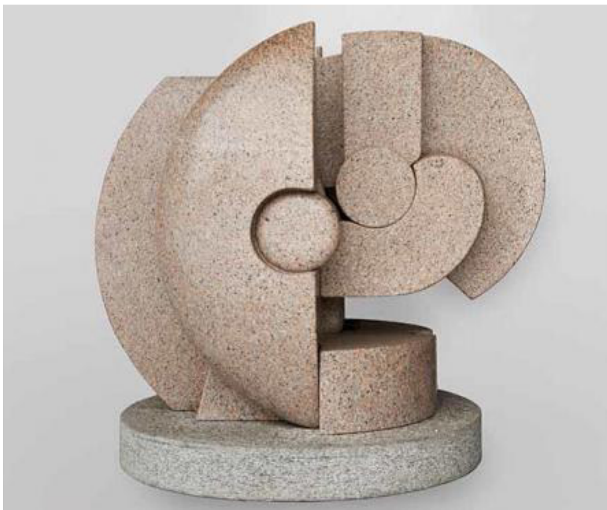
Andrea Cascella – Chimera 1976