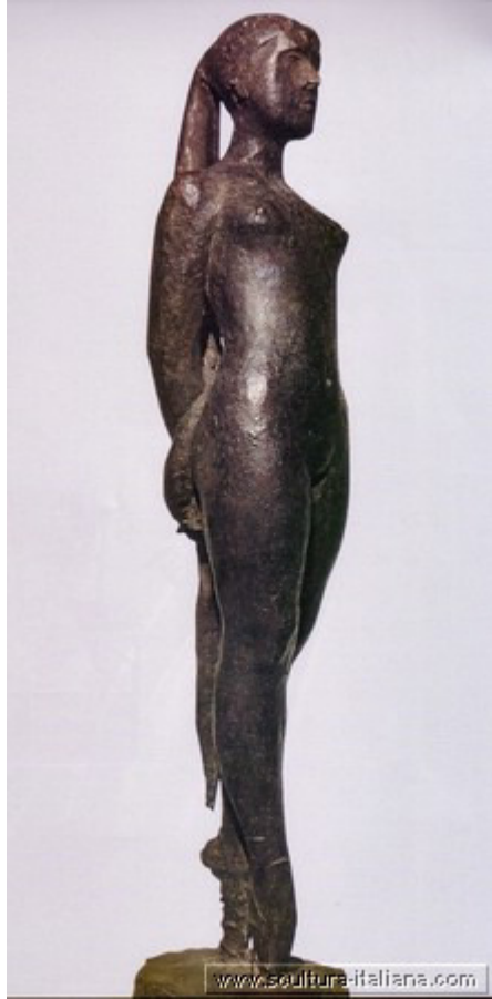
Giacomo Manzù - Passo di danza (1956)